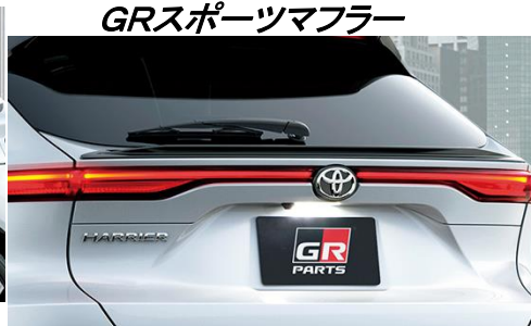
GRバックドアスポイラー