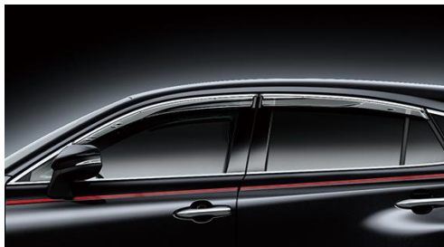
GRスポーツサイドバイザー

バイザー前後にフィン形状を織り込むことで、操縦安定性を向上させるとともに、メッキ調加飾を施すことにより、車両と調和するデザインに仕上げました。