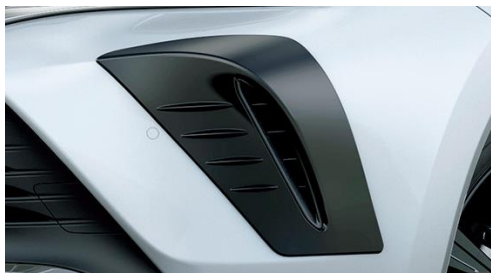
GRフロントバンパーガーニッシュ