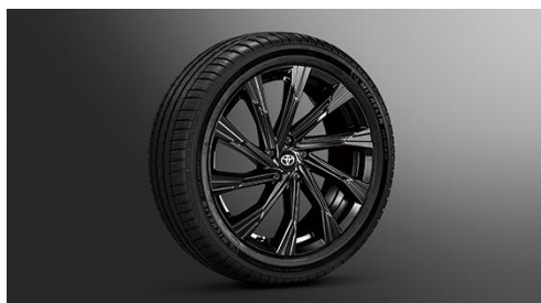
20インチアルミホイール