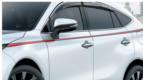
GRボディストライプ