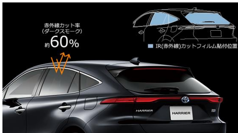
IR(紫外線)カットフィルム

バイザー前後にフィン形状を織り込むことで、操縦安定性を向上させるとともに、メッキ調加飾を施すことにより、車両と調和するデザインに仕上げました。