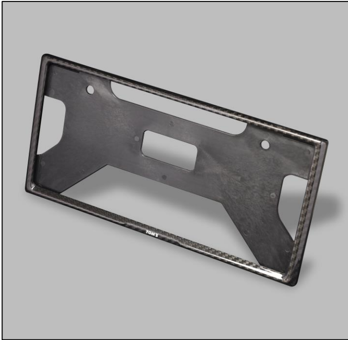
【TOM'S ドライカーボンナンバーフレーム】

～装着が簡単、ドレスアップアイテムとしても活躍～ 高品質なプリプレグ仕様のドライカーボンナンバーフレームを発売