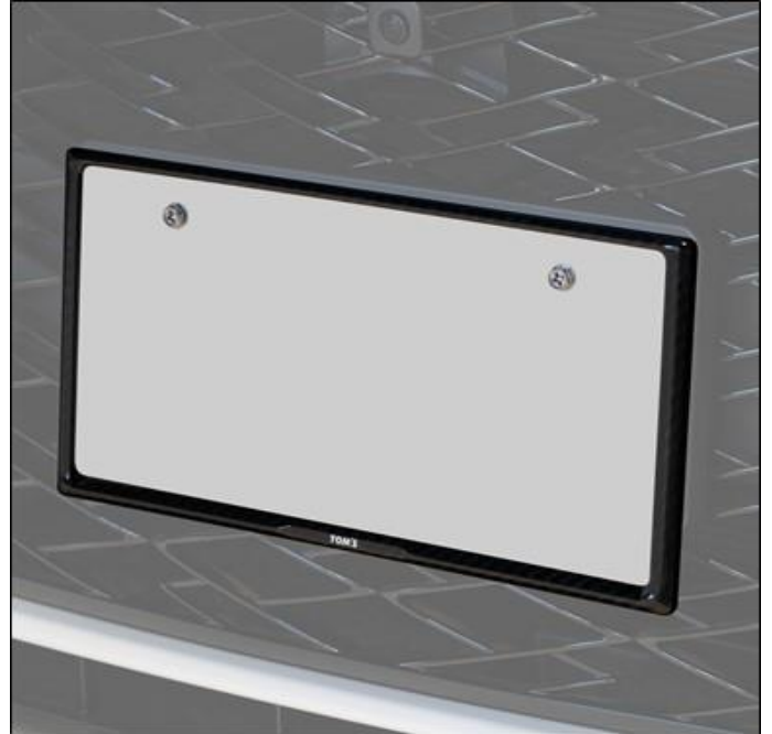
【TOM'S ドライカーボンナンバーフレーム装着例】

株式会社トムス（東京都世田谷区、代表取締役：谷本勲、以下「トムス」）は、ドレスアップアイテムとして人気の高いドライカーボンナンバーフレームを発売。簡単に装着ができ、ナンバープレートの曲がり防止にも役立つ実用性の高い定番装備です。ナンバーフレームにもこだわりを求めるお客様に向けての、高品質なプリプレグ仕様の「ドライカーボンナンバーフレーム」です。ドライカーボンナンバーフレームの下部にはトムスロゴを配置しています。