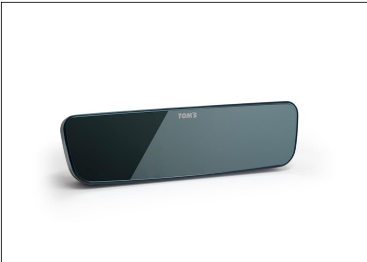
【TOM'S ワイドブルールームミラー】