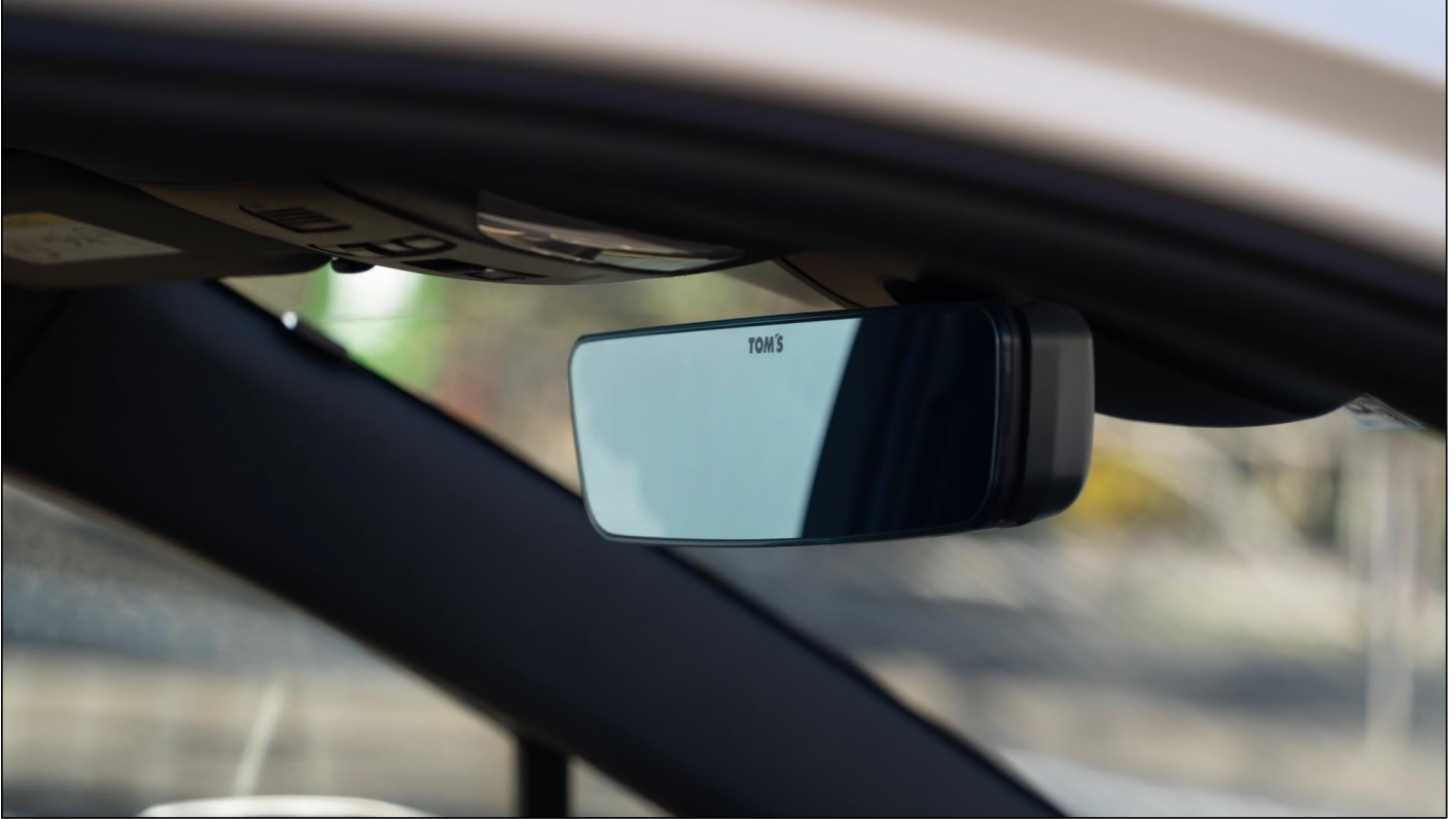
【TOM'S ワイドブルールームミラー装着例】

対応車種：カローラスポーツ・カローラツーリング（NRE21#） / ランドクルーザープラド（GDH150） / レクサス NX（AAZA2#） など多数