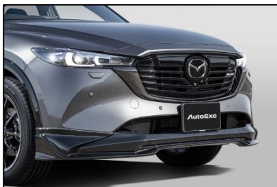
■フロントアンダースポイラー