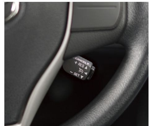
3DA-Tはトヨタ純正クルーズスイッチに対応

3DA 標準品 3DA-C 衝突軽減システム車対応品 3DA-T トヨタ純正クルーズスイッチ対応品 税込 ¥30,800 (税抜 ¥28,000)