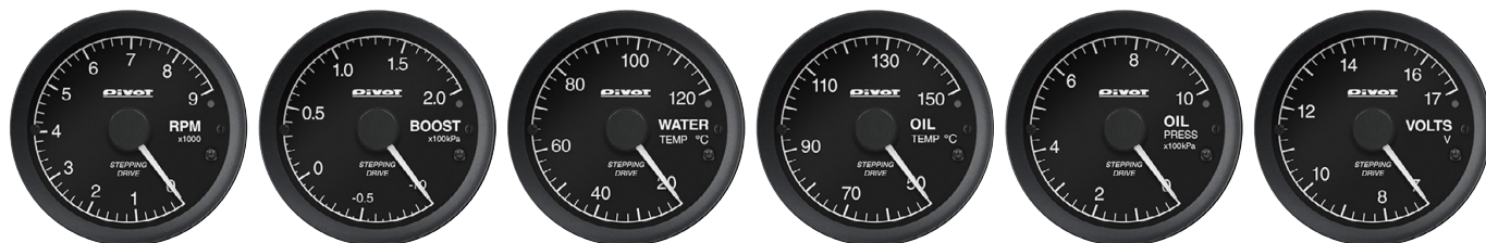
タコメーター (OBD / センサー) ブースト計 (OBD / センサー) 水温計 (OBD / センサー) 油温計 (センサー) 油圧計 (センサー) 電圧計 (センサー)