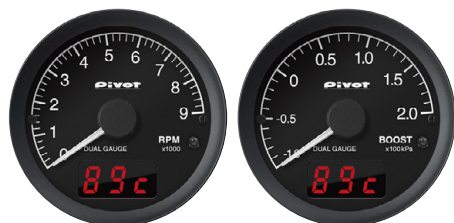
タコメーター (OBD) ブースト計 (OBD) デジタル表示: 水温 / 吸気温 / スピード / 電圧