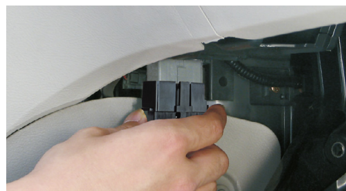
OBDタイプは故障診断コネクタにカプラーオン