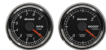
タコメーター (OBD) ブースト計 (OBD)