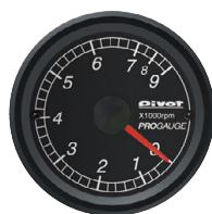
タコメーター (センサー)