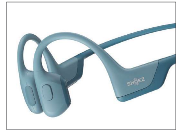
深みのある低音再生の実現。Shokz TurboPitch™ テクノロジー