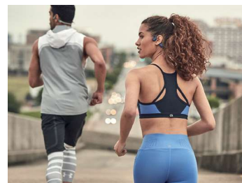
周囲の音が聞こえる安心感