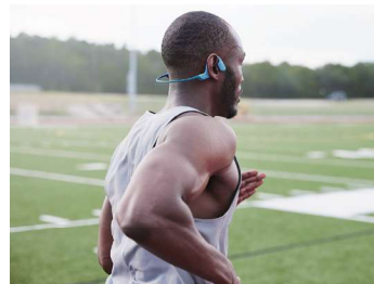
連続再生最大約10時間。音楽も通話も。