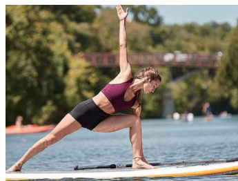
快適なオープンイヤー

※記載の情報は、2021年12月現在の情報です。製品の仕様は予告なく変更になる場合がございます。ご了承下さい。