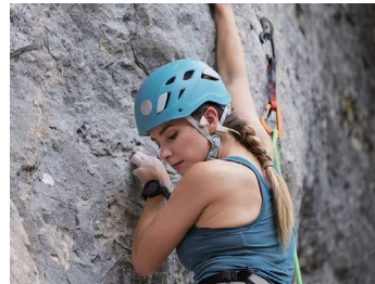
周囲の音が聞こえる安心感

※記載の情報は、2021年12月現在の情報です。製品の仕様は予告なく変更になる場合がございます。ご了承下さい。