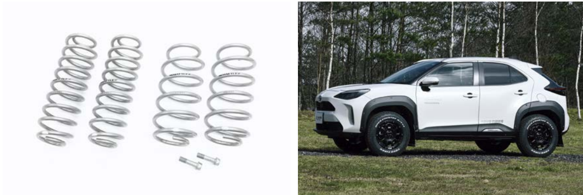
※写真は「ハイブリッド車&ガソリン車 2WD用」です。

ヤリス クロス用の「BATTLEZ リフトアップスプリング Ti-W」を発売いたします。純正ダンパーのままコイルスプリングを交換するだけで2WD用はフロント約20mm、リヤ約25mmリフトアップし、E-Four用はフロント約25mm、リヤ約20mmリフトアップ。「柔らかいけどコシがある」という特性を持つチタン配合材を使用したコイルスプリングが、運動性能をスポイルすることなくヨンクらしいシルエットを実現します。さらに、長期間安心してご使用いただくためにへタリ保証を付帯しています。