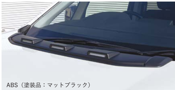
ABS (塗装品：マットブラック)