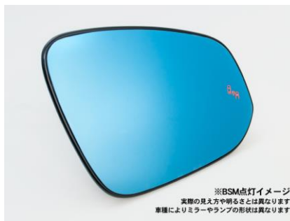
純正ミラーBSM点灯イメージ