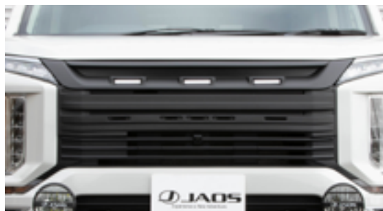
JAOS フロントグリル デリカ D:5 19+ DIESEL