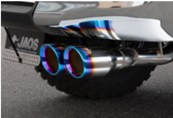
BATTLEZ マフラー ZS-2 TC 装着アップ

マイナーチェンジした新型ハイラックス用の「BATTLEZ マフラー ZS-2 / ZS-2 TC」と「BATTLEZ マフラー ZS-S / ZS-S TC」を発売します。「BATTLEZ マフラー ZS-2」は片側2本出しサークルテール。「BATTLEZ マフラー ZS-S」は米国などのピックアップトラックでは定番スタイルのサイド出しサークルテール。さらに、チタンカラーコーティングを施したドレスアップ仕様の「ZS-# TC」も設定しました。本体はどれもハイクオリティなフルステンレス製で、スポーツマインドを高める BATTLEZ ロゴの刻印入りです。スポーツマフラーらしい抑えが効いた小気味良いサウンドと軽快な吹け上がりをお楽しみいただけます。新騒音規制をクリアした認定機関発行の証明プレート付で、車検時の不安もなく安心してご使用いただけます。