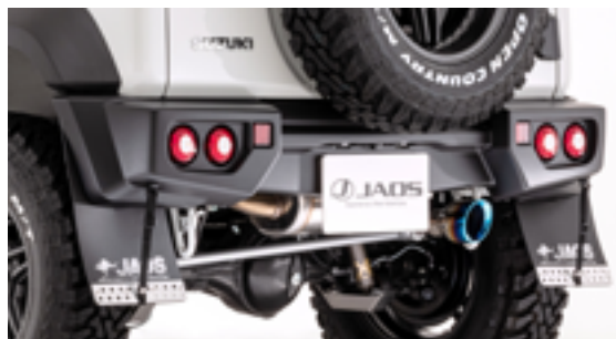
JAOS リヤスポーツカウル ジムニー JB74 系