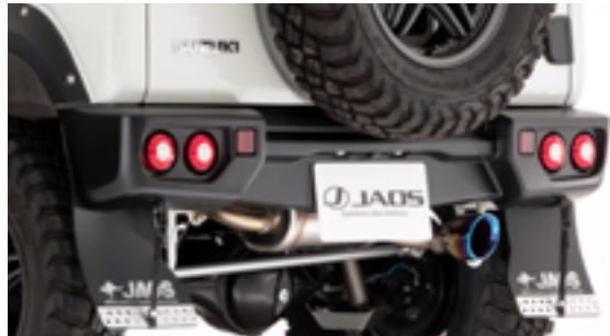
JAOS リヤスポーツカウル ジムニー JB64 系