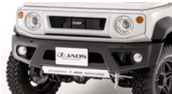
JAOS フロントスポーツカウル ジムニー JB74 系