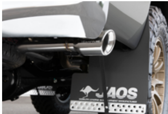
BATTLEZ マフラー ZS-S 装着全体