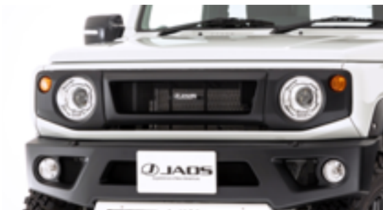
JAOS フロントグリル ※画像はジムニー JB64 系用