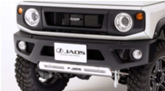
JAOS フロントスポーツカウル ジムニー JB64 系

4WD & SUV 専用のドレスアップアイテムとしてご好評いただいている「JAOS エアロアイテム」。このたび多くのリクエストにお応えして、JAOS エアロアイテムの塗装品を発売します。カラーはどんなボディカラーでも合わせやすいマットブラック（シボ塗装）で、素地のような質感がワイルドな印象を与えます。塗装作業は自動車の純正用品を取扱う専門工場で行うため、高品質で安定した供給が可能です。塗装の手間が省け、パーツが届いてすぐに取付けすることができます。設定アイテムは下記のリストをご覧ください。