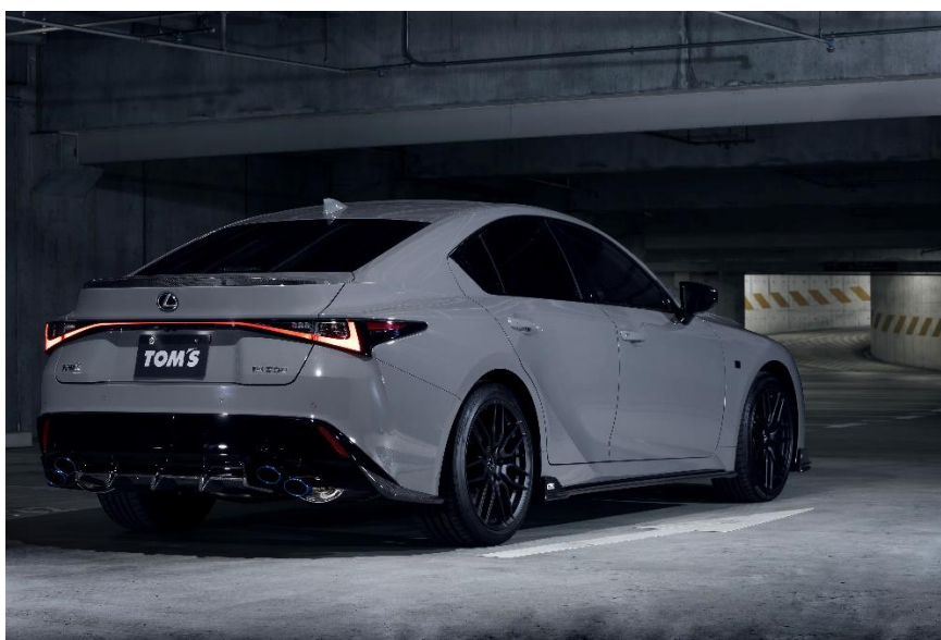
【TOM'S LEXUS IS500】