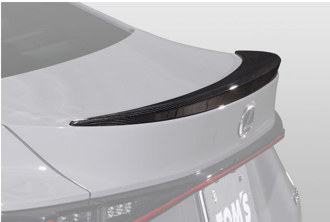
【トランクリッドスポイラー】