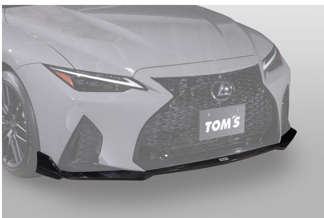
【フロントディフューザー】