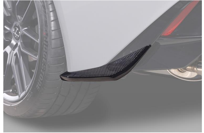
【リヤバンパーサイドフィン】