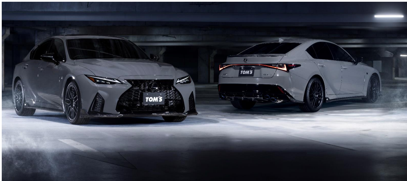
【TOM'S LEXUS IS500】