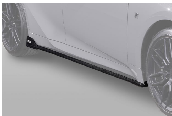
【サイドディフューザー】