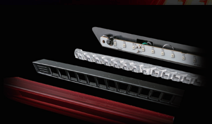
内部イメージ：レンズ、リフレクター、基板部

■保安基準適合・1年保証※1 Eマーク取得済み。保安基準適合製品です。 ※1 ポジションランプ機能を公道で使用した場合、保安基準不適合となります。