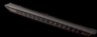
ライトスモーク/ブラッククローム