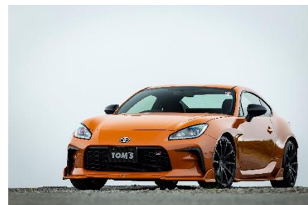
TWF04 FLAT BLACK