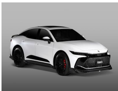
TWF02 GLOSS BLACK